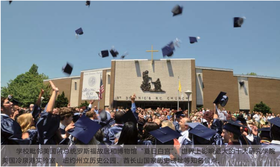
学校毗邻美国前总统罗斯福故居和博物馆“夏日白宫”、世界上影响最大的十大研究学院美国冷泉港实验室、纽约州立历史公园、酋长山国家历史遗址等知名景点。