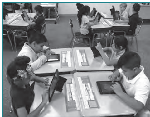
CADA ALUMNO DEL PRIMER AL TERCER GRADO TIENE UN DISPOSITIVO IPAD PARA USAR EN CLASE.

¡Cada alumno en los grados de primero a octavo tendrá una computadora portátil o un dispositivo iPad para usar en clase! Con anterioridad, los alumnos y alumnas compartían dispositivos. Después de varios años de