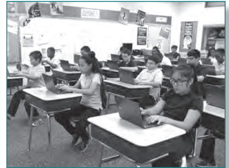
A TRAVÉS DE LA INICIATIVA TECNOLÓGICA DEL DÍA COMPLETO, CADA ALUMNO EN LOS GRADOS DEL 4 AL 8 TIENE UNA COMPUTADORA PORTÁTIL CHROMEBOOK PARA USAR EN CLASE.

preparación, los docentes de la escuela Hillside están implementando la iniciativa tecnológica del día completo , o acceso todo el día. Los alumnos y alumnas de primer a tercer grado utilizarán dispositivos iPad en sus aulas, mientras que los alumnos y alumnas de cuarto a octavo grado utilizarán computadoras portátiles Chromebook. Los alumnos de Kinder compartirán dispositivos iPad. "Pensamos que el tener acceso todo el día les dará a los alumnos y alumnas la