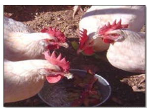
Trabajando en granjas de aves