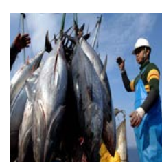
Trabajando en la pesca