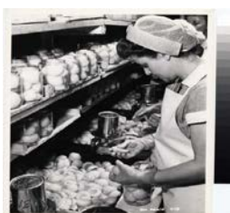
Trabajando enlatando frutas o verduras