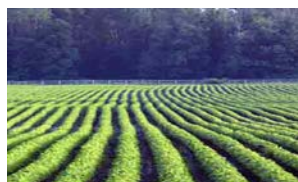
Fruta, verduras, soya, girasol, algodón, trigo, betabel, la granja o ranchos, campos y viñedos

NO (ALTO Regrese la encuesta a la escuela de su hijo/a.) SI (FAVOR elija los que apliquen abajo)