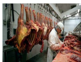
Trabajando en una casa de matanza