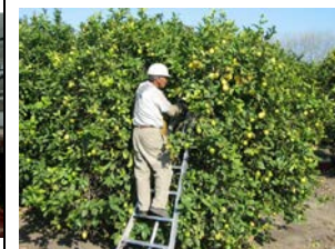
Otro trabajo similar, favor de explicar: