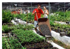
Trabajando en un vivero de plantas, plantando o cosechando arboles