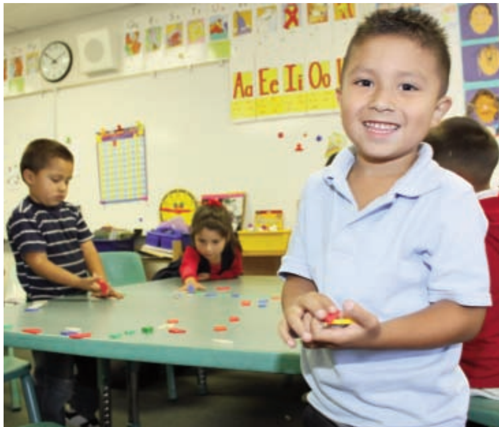
La escuela acaba de empezar para los nuevos estudiantes en Transición a Kínder en Ochoa Learning Center.

E ste año escolar trae consigo una oportunidad para que los alumnos más jóvenes de kindergarten participen en un nuevo programa que permitirá poner una buena base a las habilidades académicas y sociales tan importantes para el éxito escolar.